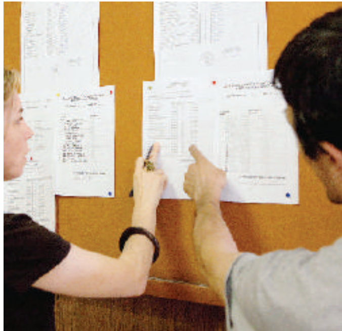
Il momento della verità: l'uscita dei risultati sui tabelloni

Agli Itis Avogadro e Pininfarina risultati in linea con gli anni passati. Qualche disguido si è registrato invece alle magistrali Regina Margherita. La severità dei commissari pare abbia fatto imbufalire alcuni genitori, che starebbero pensando addirittura di fare ricorso al Tar.